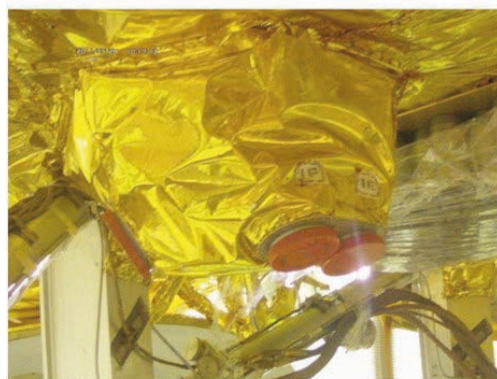
фото прибора на борту КА

А.А. ПЕТРУКОВИЧ, заведующий отделом физики космической плазмы ИКИ РАН.