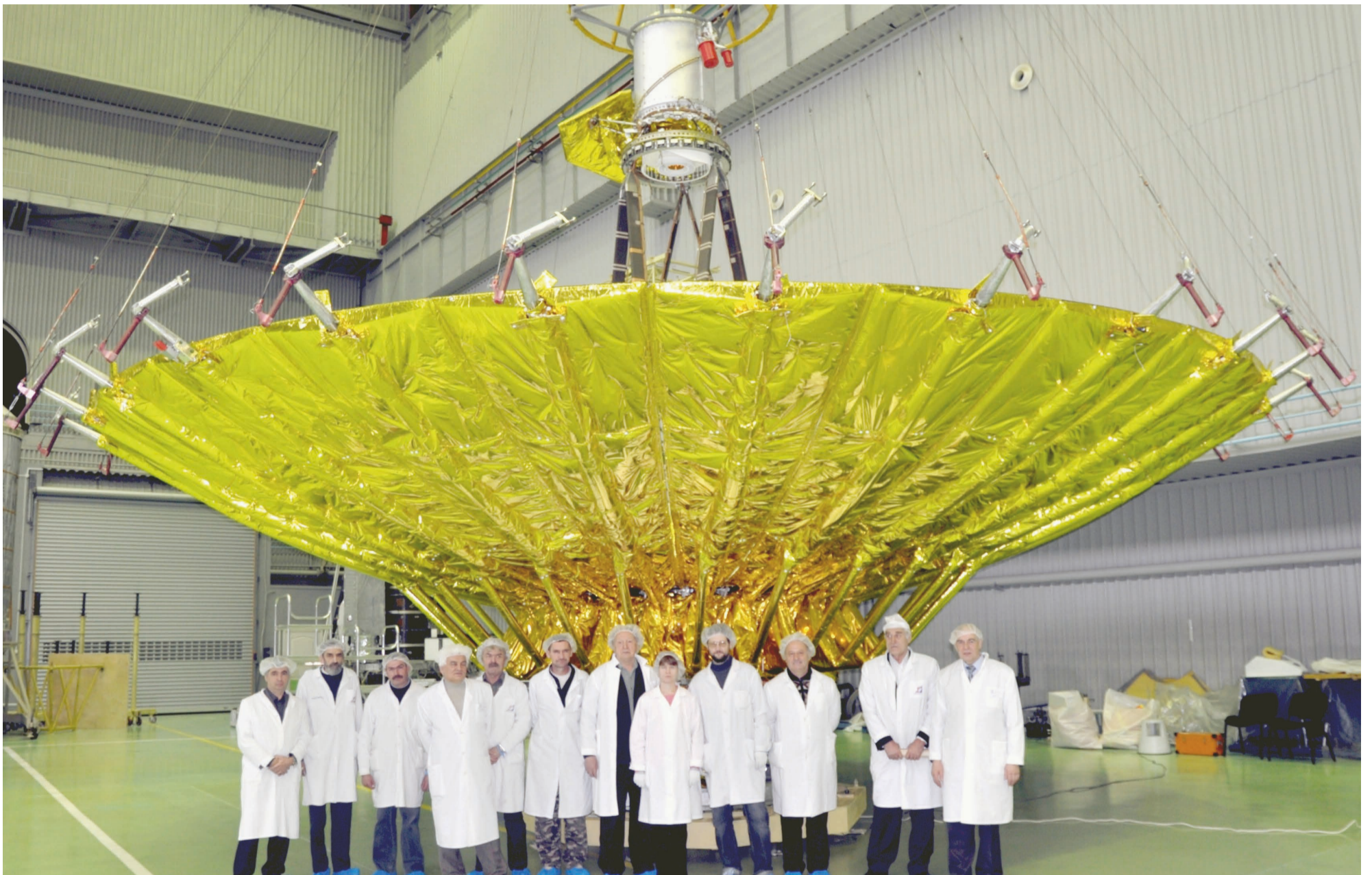
Команда разработчиков космического радиотелескопа «Спектр-Р» в сборочном цехе НПО имени С.А. Лавочкина