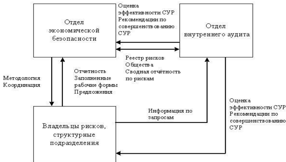
Рисунок 3 – Горизонтальное взаимодействие

Схема горизонтального взаимодействия представлена на рисунке 3.