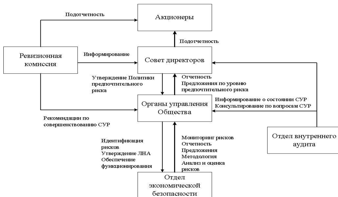
Рисунок 2 – Вертикальное взаимодействие между участниками СУР

Схема вертикального взаимодействия представлена на рисунке 2.